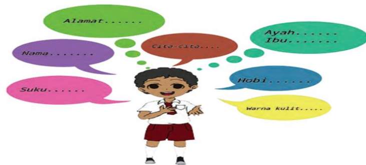
Gambar 3.4 LKPD Pembelajaran 1