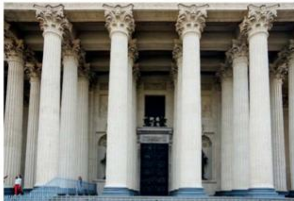
Gambar 6. Unsur dan prinsip seni rupa di sebuah bangunan (Kolom Katedral Kazan, Saint Petersburg)

Keindahan suatu objek di sekitar kita tak terlepas dari adanya berupa prinsip-prinsip seni rupa yang mendukung keindahannya, segala bentuk objek yang kita lihat dengan nilai akan muncul karena unsur-unsur yang dikandungnya, siswa dapat menemukan unsur-unsur seni rupa tersebut dengan mengamati unsur titik, garis, bidang, bentuk, ruang, tekstur, warna dan tone (nada gelap terang) yang terdapat dalam objek di lingkungan sekitar sekolah.