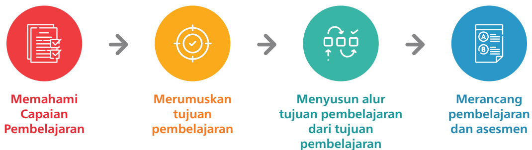
Gambar 1. Proses Perancangan Pembelajaran dan Asesmen

Pemerintah menetapkan Capaian Pembelajaran (CP) sebagai kompetensi yang ditargetkan. Namun demikian, sebagai kebijakan tentang target pembelajaran yang perlu dicapai setiap peserta didik, CP tidak cukup konkret untuk memandu kegiatan pembelajaran sehari-hari. Oleh karena itu pengembang kurikulum operasional ataupun pendidik perlu menyusun dokumen yang lebih operasional yang dapat memandu proses pembelajaran intrakurikuler, yang dikenal dengan istilah alur tujuan pembelajaran. Pengembangan alur tujuan pembelajaran dijelaskan lebih terperinci dalam Panduan Pembelajaran dan Asesmen.