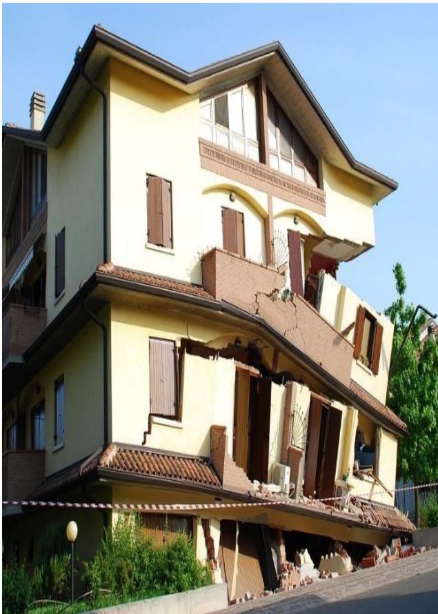
GAMBAR – GAMBAR AKIBAT BENCANA GEMPA